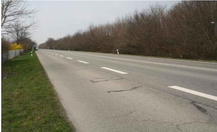
B17-alt: eine Einladung für LKW-Ausweichverkehr

Kaum ist das Verkehrsaufkommen auf der B17-alt (jetzt LL20) gesunken und wir Kauferinger atmen etwas durch, droht neues Ungemach. Die „Hauptschlagader“ (so UBV) wird stärker schlagen, denn das Bundeskabinett hat beschlossen, die LKW-Maut auf 4-spurige Bundesstraßen auszuweiten. Und dann droht die B17-alt eine hoch attraktive Ausweichroute für LKW's zu werden. Schon jetzt nimmt der Durchgangsverkehr stetig zu, sehr zum Leidwesen